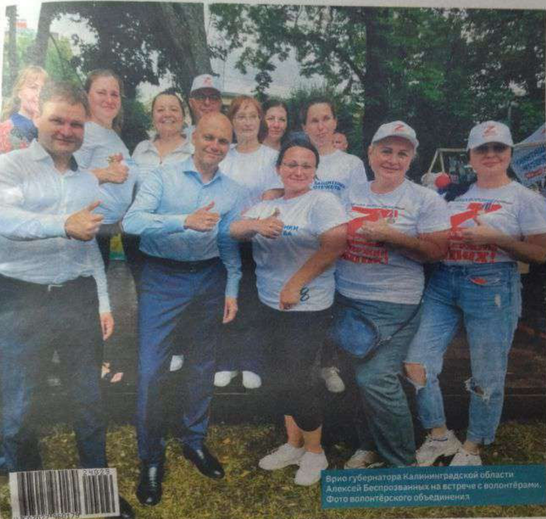
Врио губернатора Калининградской области Алексей Беспрозванных на встрече с волонтерами.

Волонтеры вносят существенный вклад в оказание помощи участникам СВО | стр. 9